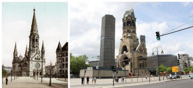
Βερολίνο. Η Kaiser Wilhelm Memorial, περίπου το 1900 και σήμερα